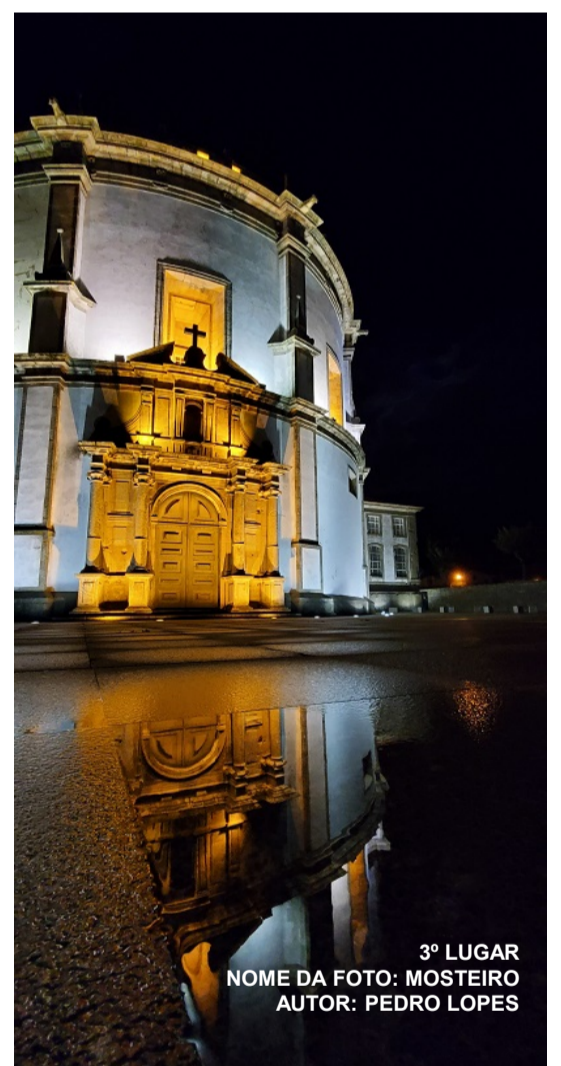
3º LUGAR NOME DA FOTO: MOSTEIRO AUTOR: PEDRO LOPES