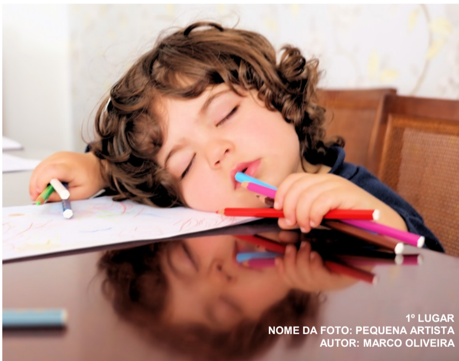
1º LUGAR NOME DA FOTO: PEQUENA ARTISTA AUTOR: MARCO OLIVEIRA

Sob o tema “Reflexos”, 39 fotografias apresentaram-se ao I concurso de 2021, proposto pelos Serviços Sociais. Reflete-se a alma, reflete-se a vida, reflete-se o objeto, reflete-se sobretudo o prazer pela fotografia, explanado nos, excelentes, trabalhos apresentados.