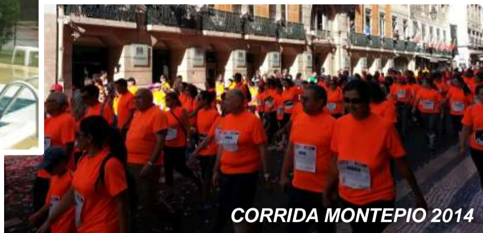
CORRIDA MONTEPIO 2014